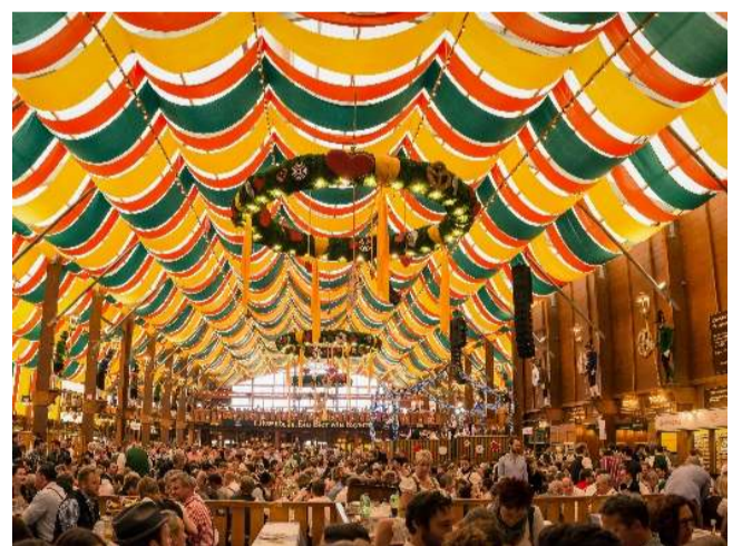
上:タイ・コムローイ祭り 下:ドイツ・オクトーバーフェスト ※あくまでイメージです(笑)