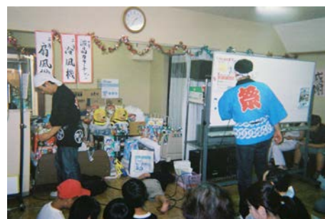
《豪華商品争奪大ビンゴゲーム》

Let 's ゼニガタの利用者さまで、ご来場の際しガイドヘルパーの派遣をご希望の方は担当者にお申し付け下さい。なお、屋台でお出しする飲食物は引換券と交換させていただきますので、当日の受付にて500円券又は1,000円券をお買い求め下さい。詳しくは事務所までお問い合わせ下さい。