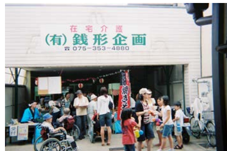
《本格屋台はいつも行列》