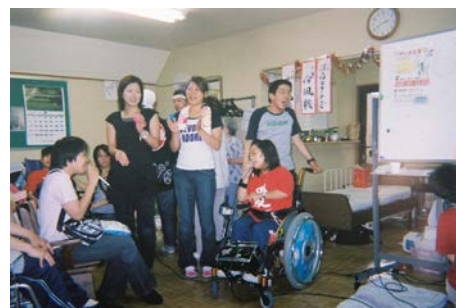
《みんなでカラオケ大熱唱》